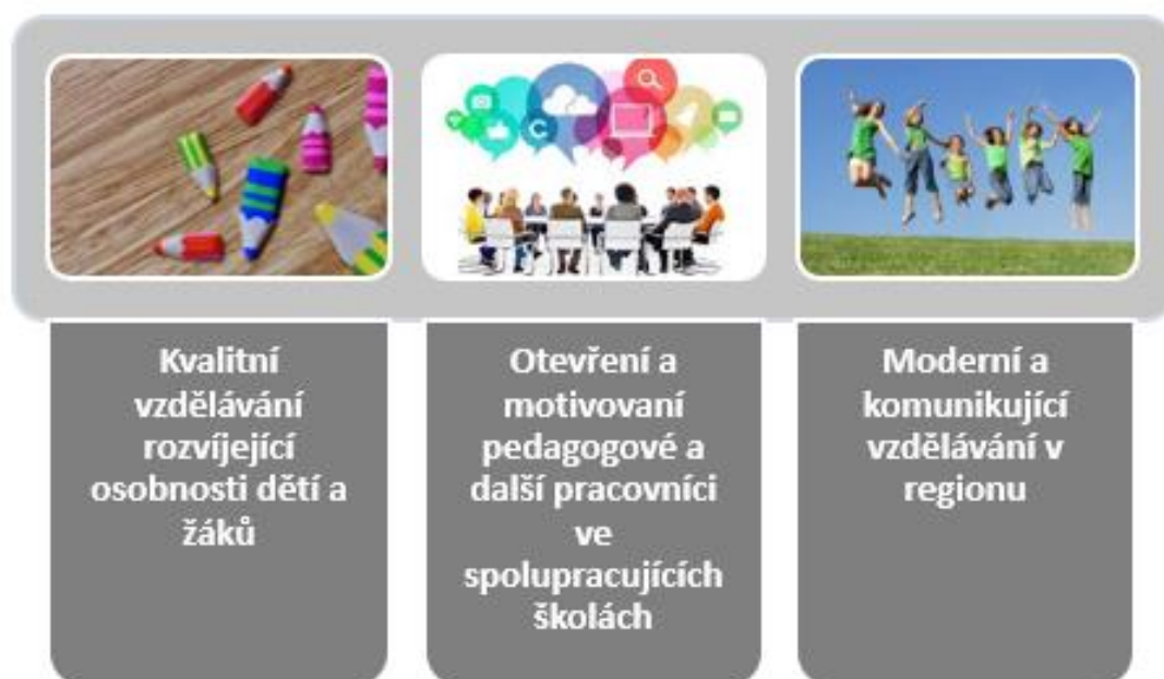
OBRÁZEK 3 PRIORITY VZDĚLÁVÁNÍ ÚZEMÍ SO ORP DOBRUŠKO

Definované priority vzdělávání dětí a žáků do 15 let na území SO ORP Dobruška