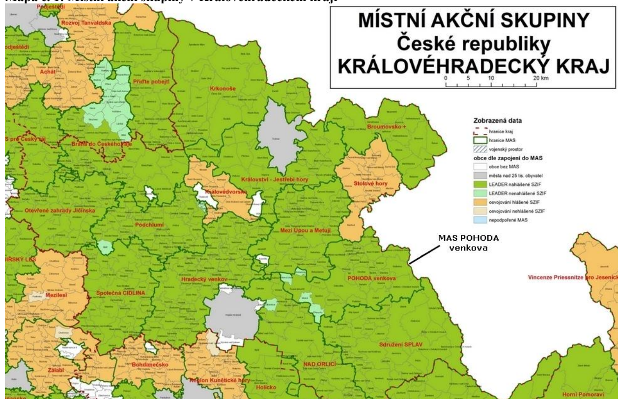
Mapa č. 1: Místní akční skupiny v Královéhradeckém kraji