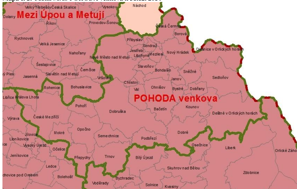
Mapa č. 2: Území MAS POHODA venkova k 31.12. 2014

Zdroj: Národní síť Místních akčních skupin České republiky, z.s.